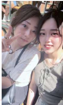
母娘旅行のひとこま