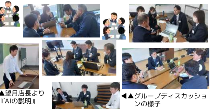
▲望月店長より『AIの説明』