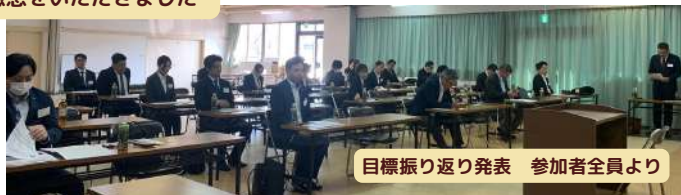
目標振り返り発表 参加者全員より

また各店責任者の方が自店での取り組み内容についても話を頂きました。 どの方の話も非常に興味深く、事業を超えて横展開出来るものばかりだったと思います。