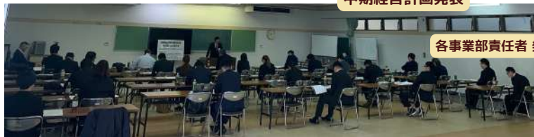
各事業部責任者 発表