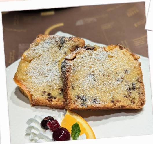
オレンジケーキ 570円(税込)