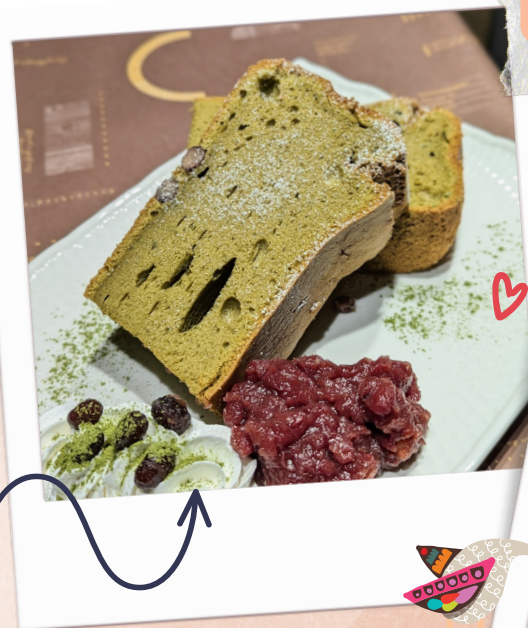
抹茶台湾カステラ 660円(税込)