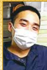
二又瀬店 ゲンズイソンさん