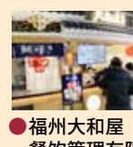
中華人民 共和国 ●福州大和屋 餐饮管理有限公司