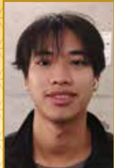
福岡東店 ゲンバンヒイウさん