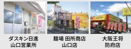
ダスキン日進 山口営業所