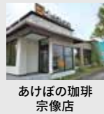
あけぼの珈琲 宗像店