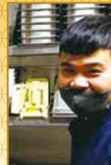
二又瀬店 ゲンチョンドックさん