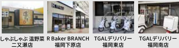
しゃぶしゃぶ 温野菜 二又瀬店