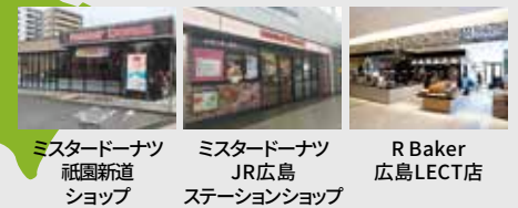
ミスタードーナツ 石見新道 ショップ