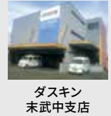
ダスキン 末武中支店