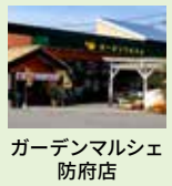
ガーデンマルシェ 防府店