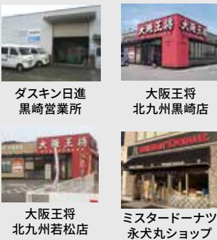
ダスキン日進 黒崎営業所