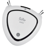
◀ロボットクリーナー SiRo(シロ)

当 営業所では除菌・清掃用具のレンタル・販売が主な業務内容です。一般家庭に向けた家事代行や、害虫駆除も行っています。現在は、正社員5名、パート10名、一般家庭などに商品を届ける委託業者(ハーティーさん)が約15名です。