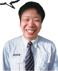
新入社員2021年6月入社

20 21年6月に営業志望で応募・入社した逸材です。現在、飛び込み営業にも挑戦しています。入社前は、自衛隊に10年間所属していたこともあり、とても精神力が強くて感心しています。