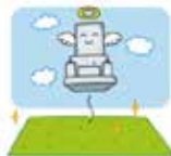
お墓の移動・移設・地上納骨室へ改良

お盆はご先祖様をはじめ亡くなった方々があの世からこの世に帰ってくる時期とされ、迎え盆の8月13日にご先祖様の御霊をお迎えするためにお墓参りに行くのが通例とされています。このようにお墓参りに行かれた際、お墓についてのお話をされることも多いのではないかと思います。お墓についてお困りごとがありましたら石材日進にお気軽にご相談ください。