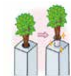
お花立を綺麗にしたい