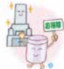
納骨室の清掃・お骨壺の整理