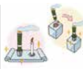
ローソク立て・お線香立てのやり替え