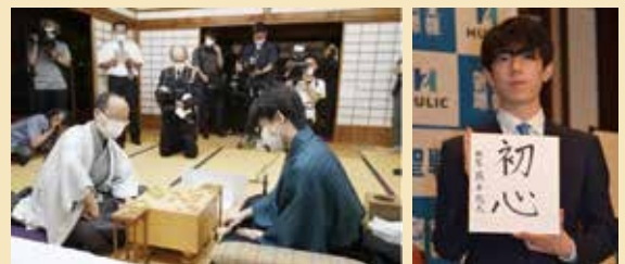
左：渡辺名人 右：藤井二冠