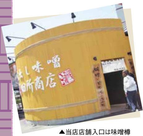
▲当店店舗入口は味噌樽

私 たちは、店舗スタッフ全員で売上目標を設定し共有しているため、日々の売上高数字を常に意識しています。そのような中で、目標を達成した際に、ジュースを飲みながら喜びを皆で分かち合ったことです。お客様が多くなるとその分大変ですが、目標を達成することが各々のモチベーションの向上に繋がっているのだと思います。