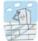
ブロック塀の洗浄