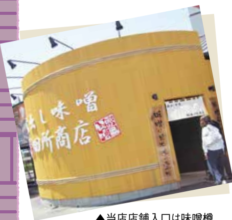
▲当店店舗入口は味噌樽

私 たちは、店舗スタッフ全員で売上目標を設定し共有しているため、日々の売上高数字を常に意識しています。そのような中で、目標を達成した際に、ジュースを飲みながら喜びを皆で分かち合ったことです。お客様が多くなるとその分大変ですが、目標を達成することが各々のモチベーションの向上に繋がっているのだと思います。