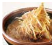
▲北海道味噌辛ネギらーめん