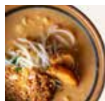
▲北海道味噌らーめん