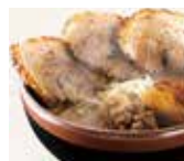
◀北海道味噌炙りチャーシュー麺