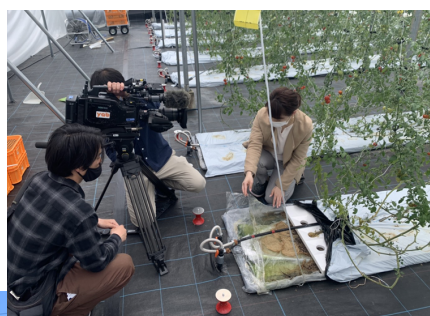
▲あけぼのファームハウス内にて