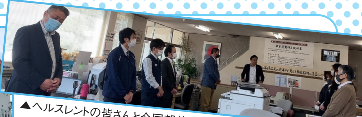
▲ヘルスレートの皆さんと合同朝礼