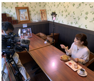
▲あけぼの珈琲にて

道の駅：きくがわ様・北浦街道豊北様・蛍街道西の市様 サンシード山口様、あけぼの珈琲、ガーデンマルシェ下関店・防府店 ※完売の場合はご了承ください