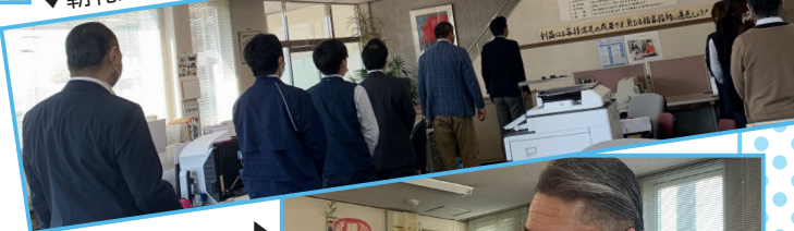
▼朝礼/企業共通理念唱和