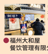
中国福建省 福州市 (7店舗) ● 福州大和屋 餐饮管理有限公司