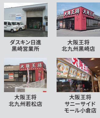
ダスキン日進 黒崎営業所