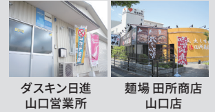
ダスキン日進 山口営業所