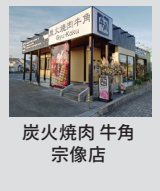
炭火焼肉 牛角 宗像店