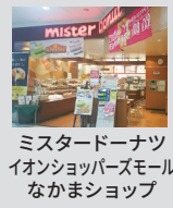
ミスタードーナツ イオンショッピングモール なかまショップ