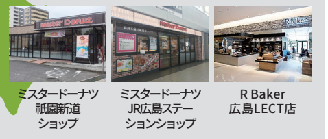
ミスタードーナツ 祇園新道 ショップ