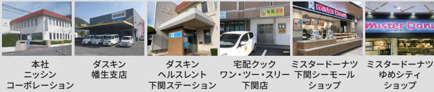
本社 ニッシン コーポレーション