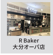
R Baker 大分オーパ店