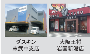
ダスキン 末武中支店