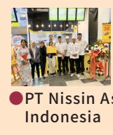
インドネシア (5店舗) ● PT Nissin Asean Indonesia