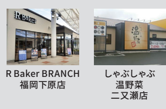
R Baker BRANCH 福岡下原店