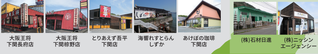
大阪王将 下関長府店