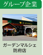
ガーデンマルシェ 防府店